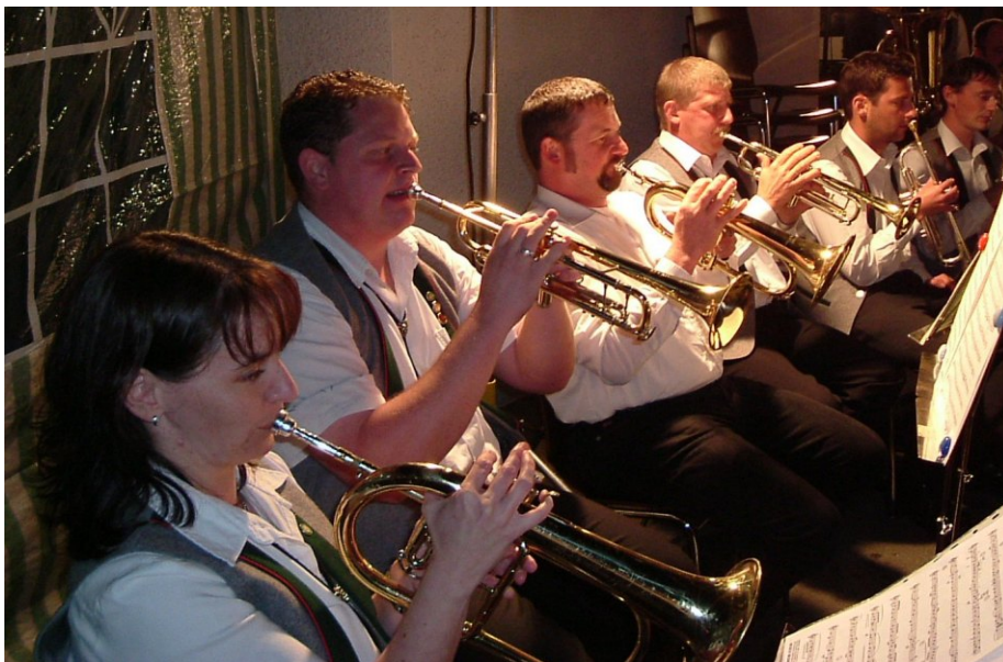
Blick ins deutsch-belgische Orchester mit Musikerinnen und Musikern aus Lommersweiler und Winterspelt