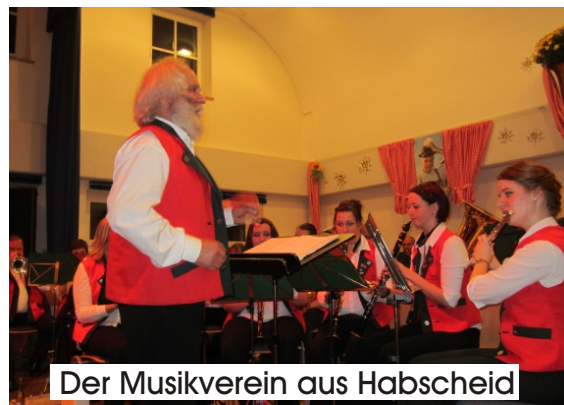
Der Musikverein aus Habscheid

Am Freitagabend gastierten die Musikvereine aus Lützkampen, Habscheid und Lommersweiler bei uns im Gemeindehaus. Nach den schönen Konzerteinlagen stellten die Vereine sich einem „Nagelwettbewerb“. Der Musikverein Habscheid versenkte als erster seinen Nagel in einem Holzstamm, so dass die Musikerschar für die nächste Musikprobe ein großes Fässchen Bier mit auf den Nachhauseweg nehmen konnten. Im Schinkenschätzwettbewerb ging der Preis dieses Mal nach Belgien. Bis auf 3 Gramm hatte ein Festbesucher aus Wiesenbach das Gewicht des Prachtstückes geschätzt. Danach sorgte die Brass-Band „Der schöne Thomas Meier“ mit fetziger Blasmusik für zünftige Hüttenfestgaudi.