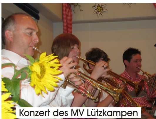
Konzert des MV Lützkampen

Vom musikalischen Mittagstisch bis in den Abend hinein unterhielten uns weitere Musikvereine aus Bleialf, Ringhuscheid, Ammeldingen, Mackenbach und Großkampenber. Die Tanzgruppe des Eifelvereines Bleialf boten dem Auge fescche Tanzeinlagen. Außerdem erfreuten sich viele an dem schönen Blumenmarkt, sowie die Kinder in der Schmink- und Bastelecke. Die Cafeteria versüßte den Nachmittag mit vielfältigen Kuchenangeboten, wovon tatsächlich kein Krümel mehr übrig geblieben ist.