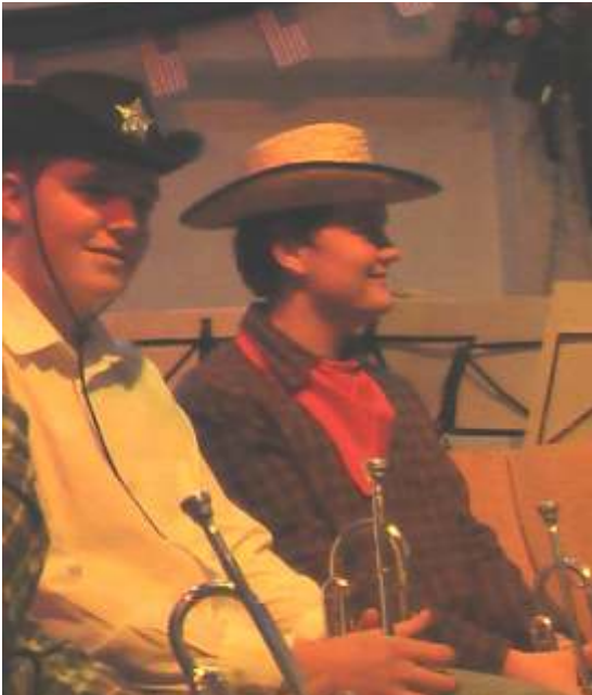
unsere feschen Cowboys ...