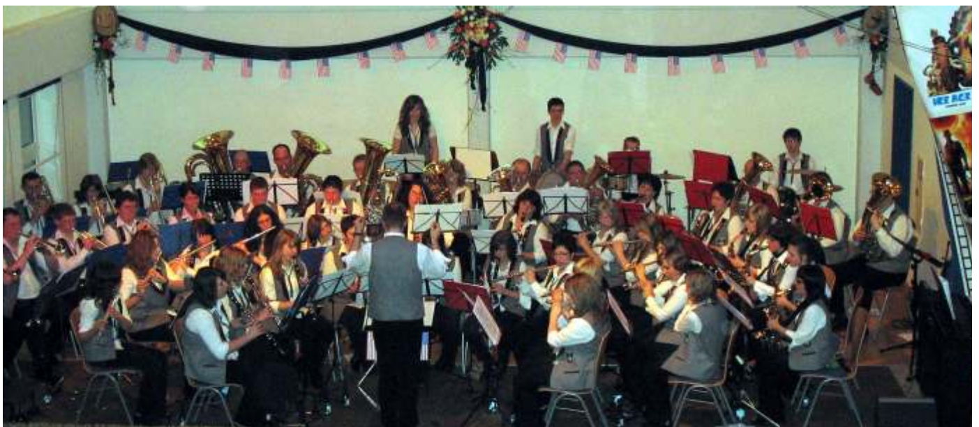
mit dem Hauptorchester in Amerika