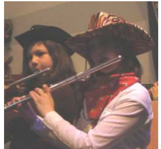
... und Cowgirls aus dem Jugendorchester