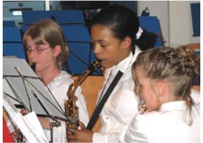
die Mädels aus dem Vororchester