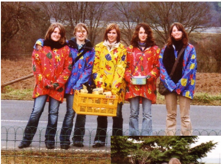
Unsere jungen Sammlerinnen