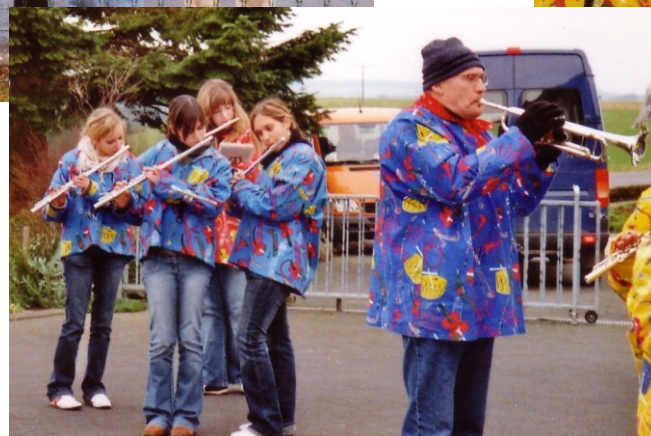
Unsere Musikerinnen und Musiker bei ihrem „Dauereinsatz“ über 12 Stunden