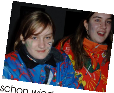
schon wieder ein Foto