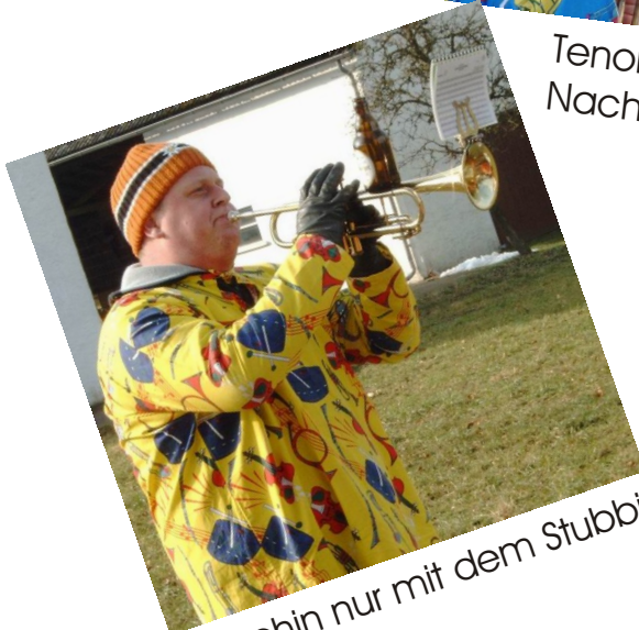
wohin nur mit dem Stubbi?