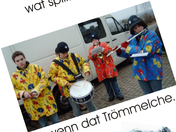
un wenn dat Trömmelche...