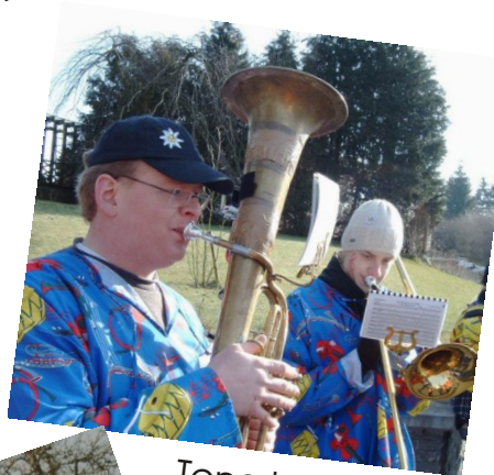
Tenorhorn mit Nachfüllstation