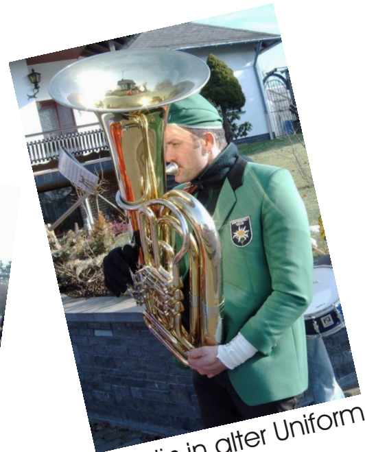
Änäräs in alter Uniform