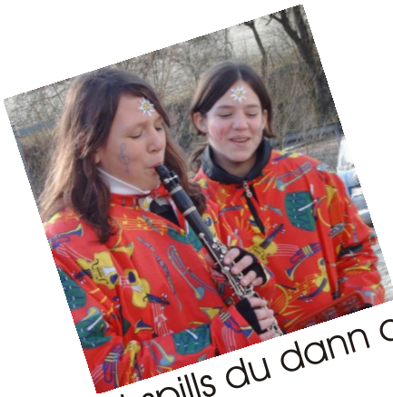
wat spills du dann do?